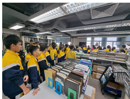
11月29日，我校六年級在明報圖書館參觀，老師講解給學生聽圖書館的東西。