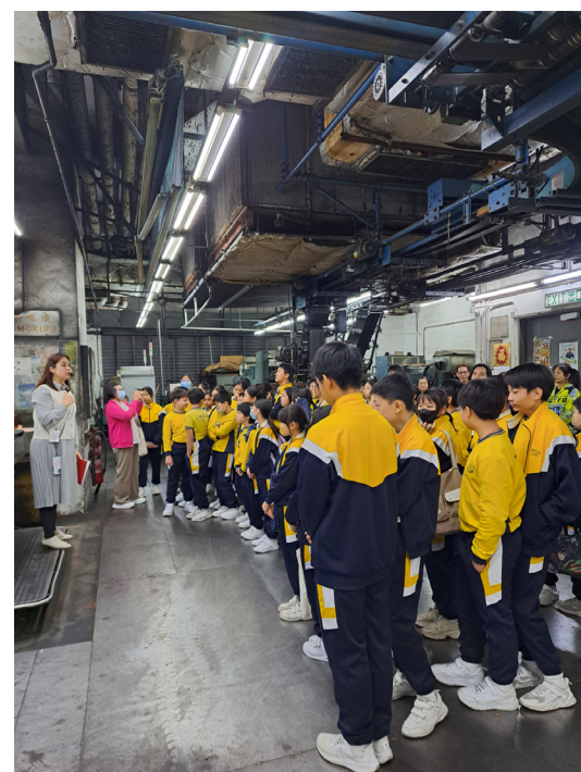
11月29日上午，我校到柴灣的明報聽何老師分享印刷報紙的過程。