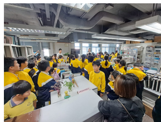
11月29日，我校六年級到了明報的資料室，學習怎麼做報紙，認識明報的歷史。