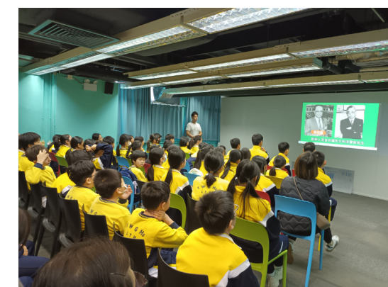
在2024年11月29日上午十時來自東華三院李東海小學的六年級學生來臨柴灣明報M SPACE聽工作人員介紹明報創辦人及明報歷史發展過程。