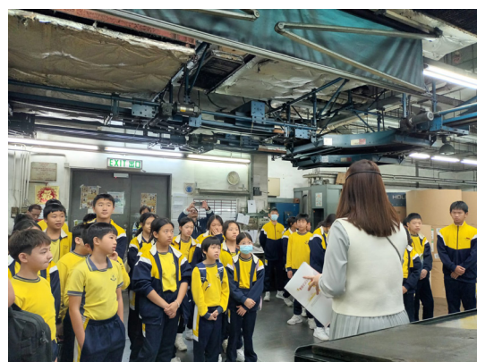
東華三院李東海小學六年級學生初遊明報報社。何導師悉心給同學們介紹廠房的結構。