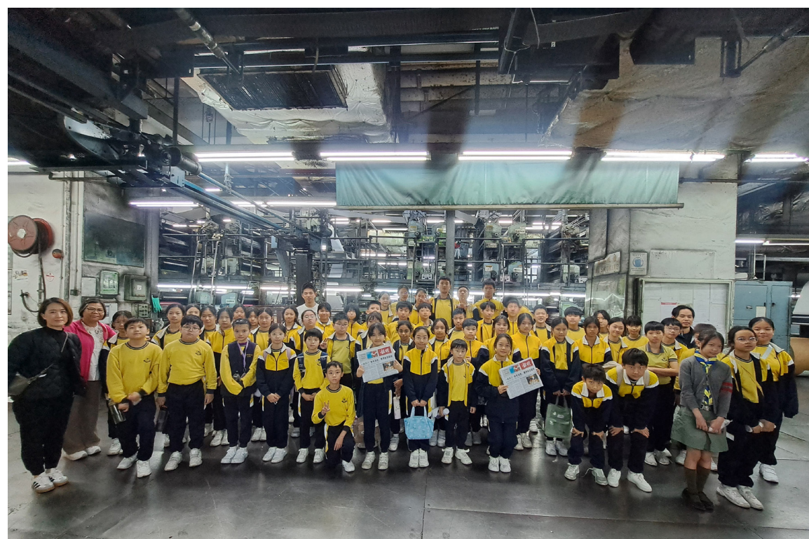
東華三院李東海小學師生參觀明報的印刷廠房，大家同呼在廠房嗅到濃重的油墨氣味。