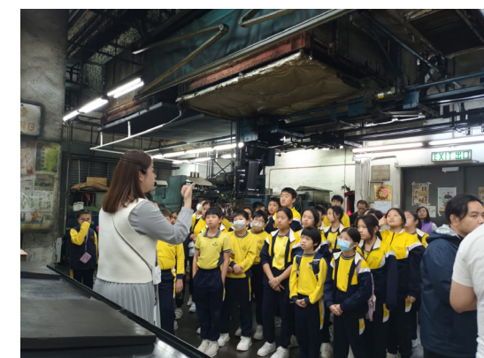
同學們正在認真聆聽何老師講解工廠環境。