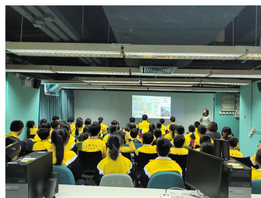
11月29日上午學生們在明報活動室，聽老師講解選取圖片的重點和要素，還有不同報社的拍照風格，學生聽得很認真。